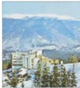
Românii au cheltuit peste 30 milioane de euro de Revelion pentru pachetele de servicii turistice