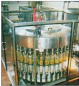
Fabricile autohtone fac față cu greu concurenței multinaționalelor