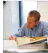
Peste 200.000 mp de birouri vor fi livrați pe piața bucureșteană