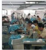
China - creșterea economică de patru ori mai mare decât cea a Europei