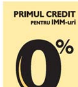
PRIMUL CREDIT PENTRU IMM-uri