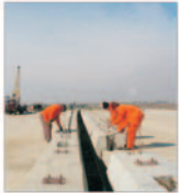
BERD a investit o jumătate de miliard de euro în transporturile din țara noastră

Norocul îi favorizează pe cei îndrăzneți. Desiderius Erasmus