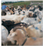
Subvenția pe capră este jumătate din cea de anul trecut