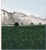
Profit brut de 2,5 milioane RON in acest an la "Instirig" Balș