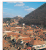
PUZ pentru construirea de vile într-o zonă de rezervație arhitecturală a Brașovului