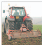
"Mecanica Marius" Cluj Napoca se menține pe linia de plutire