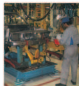
Producția industrială se adaptează la cerere