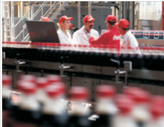
Linie de imbutoare Coca-Cola