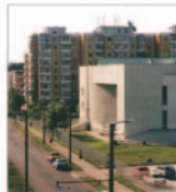
Avanșă de oferta scumpe de închiriere a apartamentelor din Arad