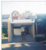
Investițiile "THR Prahova" estimate pentru 2006-2007 se ridică la peste 8.000.000 RON