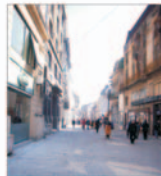
Investiții din Centrul Istoric București cer urgentarea lucrărilor de reabilitare