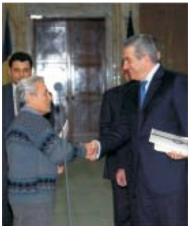
Premierul Tăriceanu a înmînat primele acțiuni ale Fondului Proprietatea în urmă cu trei săptămîni, în cadrul unei ceremonii desfășurate la Palatul Victoria. Foști proprietari ai caselor naționalizate așteaptă de 16 ani ca statul să le facă dreptate. Mulți dintre ei s-au prăpădit între timp, iar alții sînt obosiți de așteptarea în procese interminabile pentru recîștigarea drepturilor. Peva puțin dintre ei sînt înși familiarizați cu ceea ce presupune piața de capital și probabil că s-au plictisit să tot aștepte o minune. E foarte probabil ca ei să-și vîndă acțiunile care le vor bate la ușă, fără să mai aștepte locurile titlurilor pe piața de capital, o piață care, din păcate, nu le trezește niciun amintit plăcut.

● Un grup de prieteni ai premierului, politicieni controversați și specialiști în privatizări controversate, a fost numit de Guvernul Tăriceanu la conducerea Fondului Proprietatea, o afacere de peste 4 miliarde de euro ● Riscul este uriaș: prejudicierea a zeci de mii de oameni care așteaptă de 16 ani ca Statul Român să le facă dreptate și compromiterea, încă o dată, a industriei fondurilor de investiții