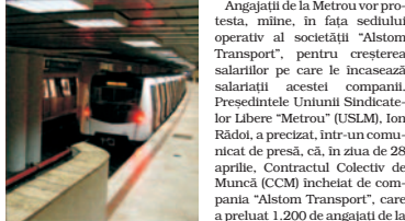
Angajații de la Metrou vor protesta, mine, în fața sediului operativ al societății "Alstom Transport", pentru creșterea salariilor pe care le încasează salariații acestei companii.