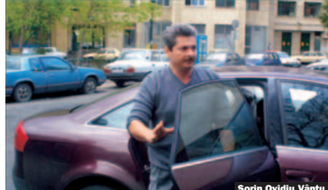
Sorin Ovidiu Vintu