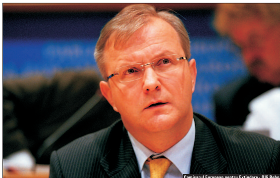
Comisarul European pentru Extindere - Olli Rehn

Comisia Europeană crede că România și Bulgaria trebuie să mai muncească pentru a primi în octombrie decizia cu privire la data exactă a integrării în UE