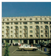
Angajații hotelului Hilton amenințați cu greva