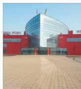
IPROLAM București pe drumul integrării europene