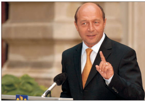
Mandata de președintele al lui Traian Băsescu para sa fi favorizat afacerii Golden Blitz, sustine sustine Mugur Ciuvică, președintele GIP.

Patronii restaurantului preferat de președintele Traian Băsescu au primit, în 2005, contracte de la Ministerul Transporturilor în valoare de peste 14 milioane euro