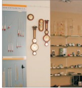
"Teimodestrin" thode spre vnzari de nu milioa de euro