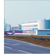
Zona Liberă Curtea-Aral a atras investiții de peste 120 milioane dolari