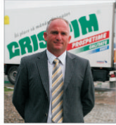
"CrisTim" urmărește un volum zilnic de vinzare de 300 tone