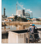
"Veolia" preia "Cleanaway UK" pentru 1,1 miliarde de dolari