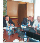
Lucrările la autostrada București - Brașov vor începe în toamnă