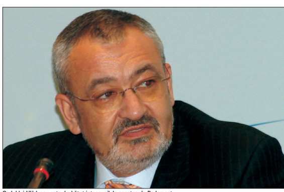
Codul lui Viădescu este dezbătut intens, zilele acestea, în Parlament.