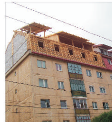
Apartamente pentru tineri la mansardele blocurilor