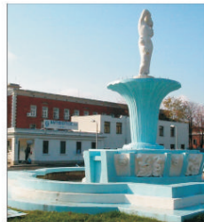
"Antibiotice" lași, la cea de-a treia încercare de a selecta un evaluator