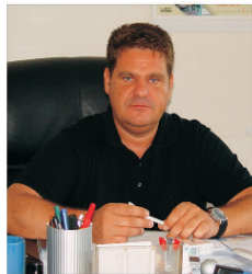
"Metropolitan" investește într-o nouă linie de fabricație