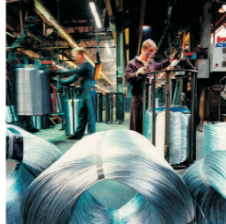
Pierderile din primul trimestru ale "Mechel Câmpia Turzii" au depășit 12 milioane RON