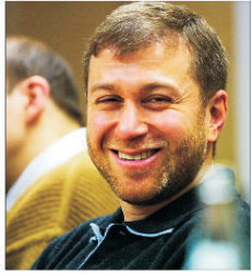
Roman Abramovici a preluat o parte din "Rosneft"