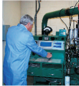
"Romcarbon" Buzău a folosit profitul din ultimii trei ani pentru finanțarea activității