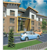
"Casarom" ar putea pierde terenurile concesionate de la Primăria Arad