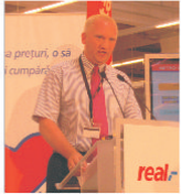
"real - Hypermarket România" a finalizat o investiție de 12 milioane euro la Constanta