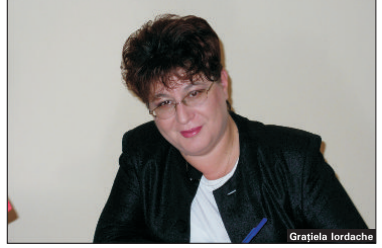
GRATIELA IORDACHE, VICEPREȘEDINTELE COMISIEI DE BUGET - FINANȚE DIN CAMERA DEPUTAȚILOR: