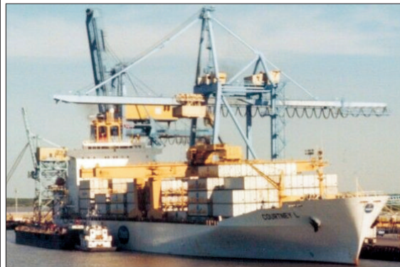
Valoarea bunurilor pe care le-am importat în primele cinci luni ale anului a depășit cu peste 3,4 miliarde de euro valoarea celor exportate.