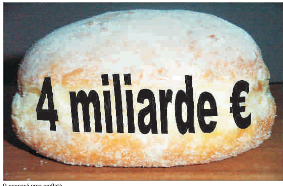
O gogoșă prea umflată

"Broadhurst Investment" a diluat substanțial participația Fondului Proprietatea la societatea "Tricodava"