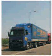
Trei șusele de centură vor fi construite în județul Arad