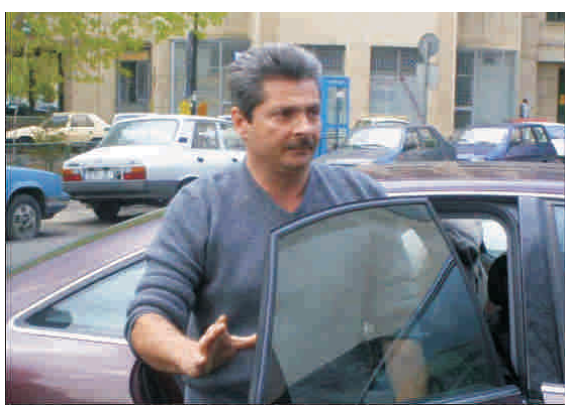
Cum-necum. Vântu a ajuns un fel de instituție