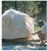
PLASAMENTE ALTERNATIVE Sculpturile care ne lipsesc