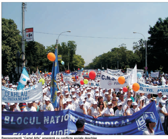
Reprezentanții "Cartel Alfa" amenințați cu conflicte sociale deschise