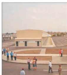
Licitație publică pentru închirierea spațiilor în Piața de Gros din Timișoara