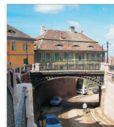
Municipalitatea sibiană va construi cinci blocuri de locuințe sociale