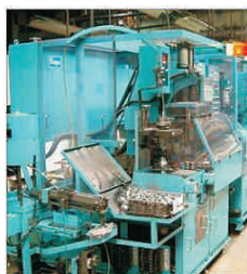
Exportul a adus venituri de peste 50 milioane de lei societății "Rulmentul" Brașov