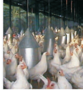
„Avicola” lași a resimțit din plin valurile de gripă aviară