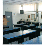
Ministerul Educației aloacă 12,5 milioane de lei pentru învățământul ieșean