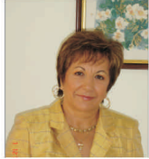
FCGR a garantat mai multe credite rurale