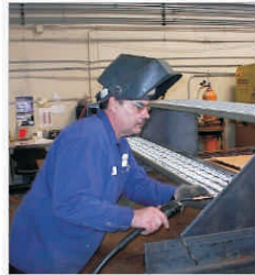
“Aromet” Buzău investește un milion de euro pentru creșterea calității produselor