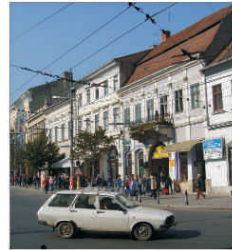
Chirile apartamentelor din Cluj-Napoca s-au dublat