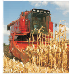
“Naturevo” București acuză “sistemul legislativ incorect”