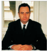
"Darian" și-a dublat cifra de afaceri în prima jumătate a anului