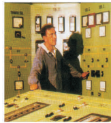
"GHCL Upsom" - pierderi de peste 9 milioane de lei în primul semestru