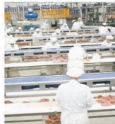
Investiții de peste 170 milioane de euro în avicultura autohtonă