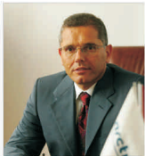
"Arctic" nu dezamăgește Grupul "Arcelci"