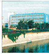
"Timpuri Noi" București se pregătește pentru intrarea în domeniul fabricației pieselor auto