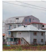
"Euro Trend" construiește spații comerciale și apartamente în centrul Clujului

În industrie nimic nu este imposibil. Proverb latinesc