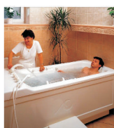
"Turism Felix" a depășit deja veniturile și profitul prognozate pentru anul 2006