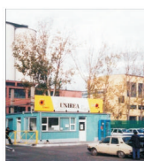
Profitul realizat de "Unirea" lași, în primele nouă luni, se apropie de 12 milioane lei