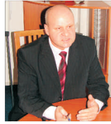
Construcții din Moldova vor avea și ei o casă socială