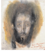
PLASAMENTE ALTERNATIVE Baba, centenarul