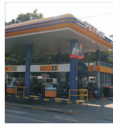
"OMV" susține că a dat statului peste 40% din profitul "Petrom"