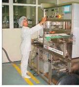
"Antibiotice" lași plătește dividendele în termen de 60 de zile