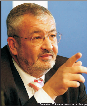
Sebastian Vlădescu, ministru de finanțe