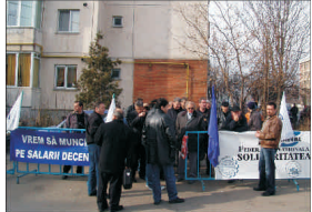
Intregul proces de restructurare din industria armamentului a fost balversat prin trecerea "Romarm" de la Ministerul Economiei și Comerțului la AVAS, odată cu Oficiul Participațiilor Statului și Privatizării în Industrie (OPSI).

Restructurările promise industriei de apărare sunt așteptate cu teamă de lucrătorii din acest sector, din moment ce încă nu se știe câți disponibilizați vor fi și câte fabrici vor rămâne în picioare