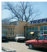
"Trefo" Galați - cifră de afaceri de peste 54 milioane de lei