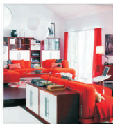
Primum magazin IKEA, din 21 martie