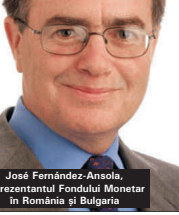
Juan José Fernández-Ansola, reprezentantul Fondului Monetar în România și Bulgaria

Fondul avertizează o inflație de peste 5% la finele acestui an, adică în afara coridorului de variație a 5% de inflație de 3% - 5%.