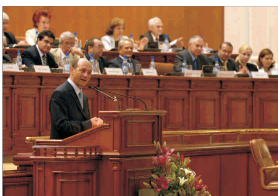
Prin decizia Curții Constituționale, Băsescu scapă de posibilitatea de a rămâne la mîna parlamentarilor.

Teoretic apare posibilitatea ca președintele să fie demis, dar, practic, Traian Băsescu poate ieși mult mai întărit după 19 mai