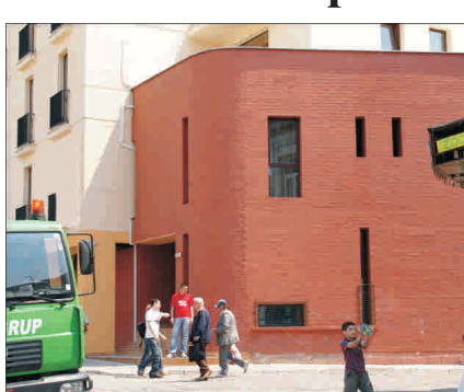
Clădirea maro din imagine poate fi considerată o inserție nefericită în centrul istoric.