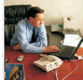
"Titan Mar" investește 5,5 milioane de euro într-o nouă locație