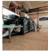
"Danone" cumpără "Nimico", plătind în schimb 12,3 miliarde de euro