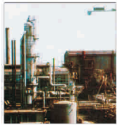
Încă două tranzacții Deal cu acțiuni "Amonit"