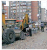
Primăria Lugoj investește peste un milion de lei în trotuare