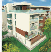
"ECM Real Estate" întindește piețele din Polonia, România și Ucraina