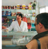
Calitatea lactatelor și a preparatelor din carne, afectată de caniculă