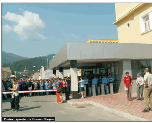
Protest spontan la Roman Brașov

Angajații punctului de lucru din Brașov al Dacia Pitești au reluat ieri lucrul, după mai mult de o lună