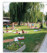
Băile Nicolina vor fi aduse la standarde europene