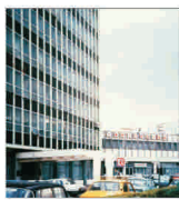
"Iasiteț" lasă și în casa peste 21 milioane de euro din vânzarea terenului excedentar