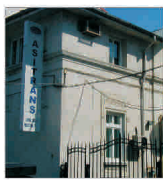
"EuroHold Bulgaria" a achiziționat "Asitrans Asigurări"