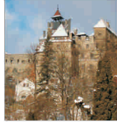
Mitul Dracula - confiscat de niște bucureșteni