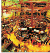
NYSE Euronext și-a majorat beneficiile cu peste 160%