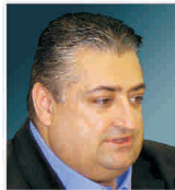
Prefectura Timiș vrea să blocheze în instanță proiectul imobiliar al patronului echipei Poli