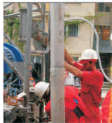
„E.ON Gaz” România și-a sporit profitul cu 10%