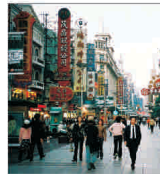
China ar putea deveni al doilea exportator mondial în 2007