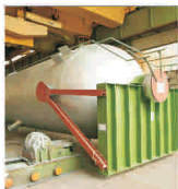
Intrarea în exploatare a Unității 2 va dubla cifra de afaceri a „Nuclearelectrica”