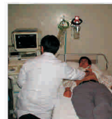
Lucrările la Spitalul regional din Timișoara vor demara în aprilie 2008