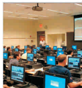
Reglementările sunt foarte importante, însă piața dictează evoluția în IT