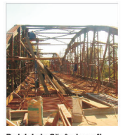
Podul de la Săvârșin va fi finalizat în acest an