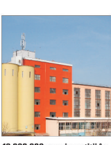
"Bella" și-a majorat vânzările prin diversificare

10.000.000 euro investiții în următorii ani la societatea "Moara Cibin"