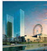
Noua valoare a proiectului "Dâmbovița Center" - 600 milioane de euro