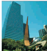
Charles Prince părăsește "Citigroup"