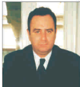
"Darian" și-a majorat cifra de afaceri cu 30%