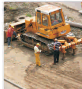
Canalizarea din Arad atrage companii din afara țării