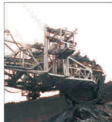
"BHP Billiton" vrea să fuzioneze cu "Rio Tinto Group"