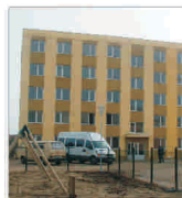
Primăria Arad construiește trei blocuri pentru evacuații din casele naționalizate