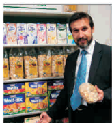
"SanoVita" își reorganizează activitatea, înființând două divizii