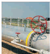
"Romgaz" va investi circa un miliard de euro în dezvoltarea de noi resurse de gaze