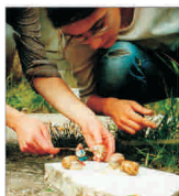
Escar Prod se împrumută pentru a finaliza fabrica de melci