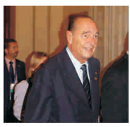
Postul președinte francez Jacques Chirac a fost inculpat

pentru deturnare de fonduri, situație care reprezintă o premieră în Franța. Chirac, care și-a terminat mandatul în luna mai, a fost supus interogatoriului ieri, în legătură cu o schemă falsă de locuri de muncă întocmită în perioada în care a fost primar al Parisului.