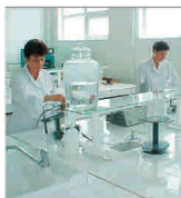
Sindicatul de la "Antibiotice" lași dă în clocot