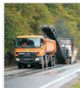
Lucrările de modernizare a DN 7 au fost sistate din cauza "Romgaz"