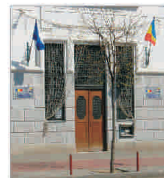
Primăria Timișoara speră să obțină 15 milioane de euro din vânzarea Cazarmei "Viena"