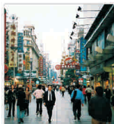
Scade excedentul comercial al Chinei