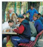
APAPR nu susține propunerea de garantare a randamentelor pensilor