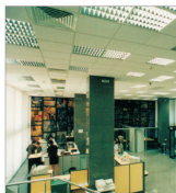
Trei fonduri străine vor investi 6,6 miliarde dolari în "Merrill Lynch"