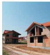
Gălățenii și-au reorientat afacerea imobiliară către piața terenurilor