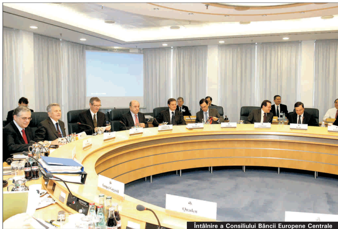
Întâlnire a Consiliului Băncii Europene Centrale